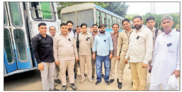
फतेहाबाद। काले बिल्ले लगाकर विरोध जताते रोडवेज कर्मचारी।