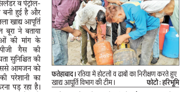
फतेहाबाद। रतिया में होटलों व ढाबों का निरीक्षण करते हुए खाद्य आपूर्ति विभाग की टीम।

उन्होंने बताया कि गैस की कालाबाजारी व जमाखोरी को रोकने के लिए ब्लॉक स्तर पर विशेष टीम का गठन किया हुआ है। इन टीम द्वारा जिलेभर में होटलों, रेस्टोरेंट, मिठाई की दुकानों व ढाबों पर लगातार छापेमारी अभियान चलाया जा रहा है, ताकि घरेलू गैस का कमर्शियल