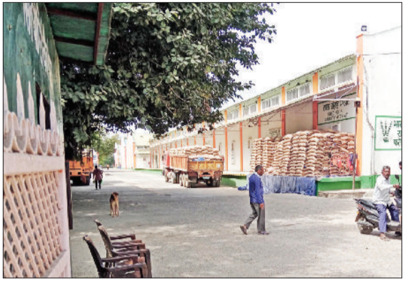
फतेहाबाद। मंडी में लंदे खड़े गेहूं के ट्रैक्टर।

प्रदेश सरकार की तरफ से गेहूं की सरकारी खरीद आज से शुरू हो गई है। मौसम के बदले तैवरों के चलते माना जा रहा है कि 10 अप्रैल से पहले मंडियों में गेहूं नहीं आएगी। किसान जब मंडियों में गेहूं लेकर आएंगे, खरीद एजेंसियों को 24 घंटे में गेहूं उठाकर अपने गोदामों में शिफ्ट करना होगा। सीजन शुरू होने से पहले ही जिले में अनाज के भंडारण को लेकर संकट गहराने लगा है। दरअसल अधिकांश सरकारी और निजी गोदाम पहले से ही चावल से भरे पड़े हैं, जिससे मंडियों में आने वाली नई गेहूं की फसल के भंडारण को लेकर प्रशासन और खरीद एजेंसियों की चिंता बढ़ गई है। एक अनुमान के अनुसार इस बार जिले की मंडियों में करीब 7 लाख एमटी गेहूं की आवक होने की संभावना है।