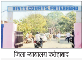
जिला न्यायालय फतेहाबाद