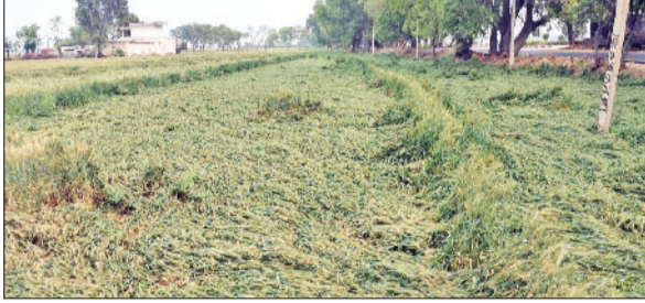
फतेहाबाद। बरसात व ओलावृष्टि से बिछी फसल।

पश्चिमी विक्षोभ के एक्टिव होने के चलते पिछले दो दिनों में बारिश, ओलावृष्टि व अंधड़ से फतेहाबाद जिले में 20 से 80 फीसदी तक गेहूं की फसल नष्ट हो गई है। जिले के भट्ट खंड के करीब 6 गांव, फतेहाबाद व नागपुर के 13 गांवों में भयंकर बर्बादी हुई है। जिला प्रशासन ने गेहूं की पकी हुई फसल में खराबे की रिपोर्ट सरकार को भेज दी है। हालांकि इसमें मंगलवार को हुई बरसात से खराबा कम हुआ है जबकि एक दिन पहले ही बरसात से 80 फीसदी तक फसलें खराब हुई हैं। जिला उपायुक्त द्वारा वित्तायुक्त एवं अतिरिक्त मुख्य सचिव, राजस्व एवं आपदा प्रबंधन विभाग को भेजी रिपोर्ट में बताया है कि 29 मार्च को हुई बरसात से गांव भूथनकला, झलनियां व भिरड़ाना में 70 से 80 प्रतिशत, माजरा व बीसला में 50 प्रतिशत, बरसीन में 22 प्रतिशत, हिजरावां कलां, अकांवाली, दैलतपुर, दरियापुर व करनौली में 20 प्रतिशत तक फसलों को नुकसान हुआ है। डीसी की रिपोर्ट के अनुसार रतिया, टोहाना, जाखल, भूना, भट्टकलां व