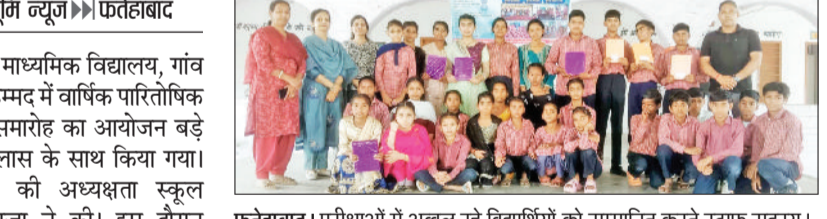
फतेहाबाद। परीक्षाओं में अव्वल रहे विद्यार्थियों को सम्मानित करते स्टाफ सदस्य।