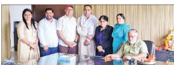
फतेहाबाद। डिवाइन इंटरनेशनल स्कूल में कार्यभार संभालते नई प्रबंधन कमेटी।